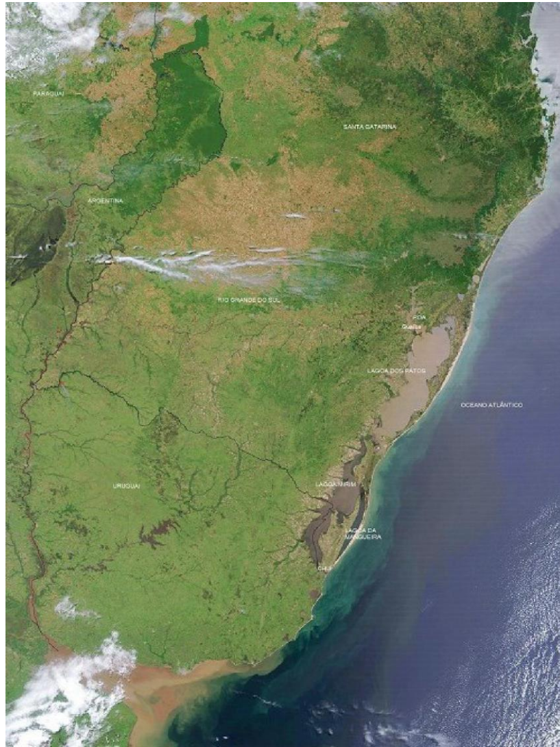
Fig. 3: Sistema lagunar en el Atlántico Sur.

El litoral costero de Uruguay se extiende por 670 km; de ellos 220 km sobre el Océano Atlántico, corriendo en dirección SW-NE, siendo más pronunciado en sentido Norte desde el Cabo de Santa María. En esta costa, que se continúa en el Sur de Brasil, se ubican una serie importante de lagunas costeras, dos de las cuales son de las mayores existentes en el planeta, la Laguna de los Patos y la Laguna Merin (Ministerio de Transporte y Obras Públicas del Uruguay, MTOP 1979).